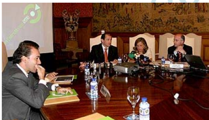
“Presentación Oficial del Plan Estratégico”

Los promotores del Plan elaborarán un documento que no hará tabla rasa de los trabajos realizados con anterioridad (Plan Estratégico de Pontevedra y un programa similar en el área de Vigo), sino que procurará no repetir trabajo ya realizado y aprovechar a la vez aquellos estudios o proyectos que nos pueden ser útiles para la elaboración de nuestro plan.